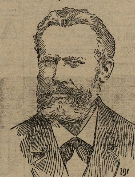
Pablo Iglesias delegado en el Congreso de Amsterdam, elegido por el Partido Socialista Obrero Español

—Otra aprobando el presupuesto de adquisición de maquinaria agrícola para la Granja-Instituto de agricultura de Palencia.