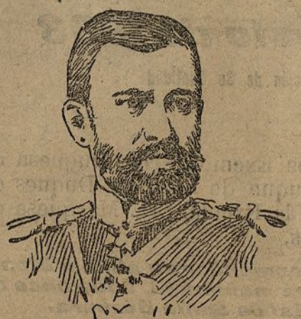
El general ruso Stackelberg

Se cree que la inacción de las autoridades