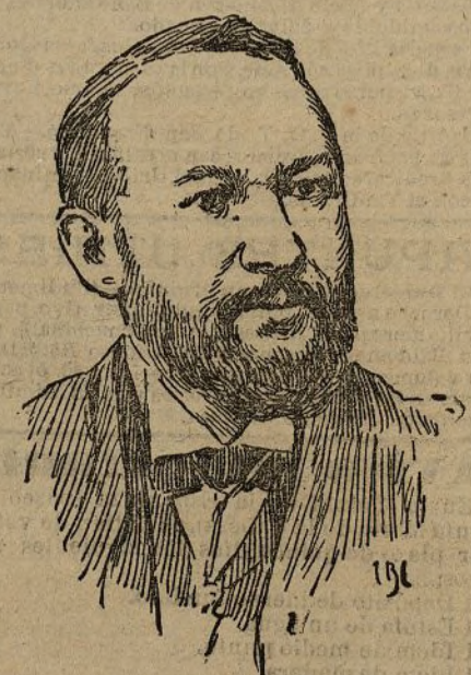
El presidente Sr. Infante