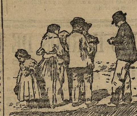
Legioneros el folio del Dr. Maestro.

No creo necesaria esa manifestación. Yo, puesto allí en aquella alcoba, contemplando la colocación de los muebles, juré que no hay posibilidad de entrar y salir, vestirse y