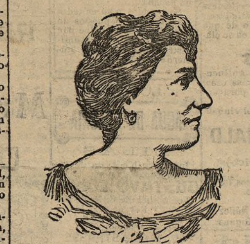
La princesa Luisa

Luisa de Sajonia, que desde el principio