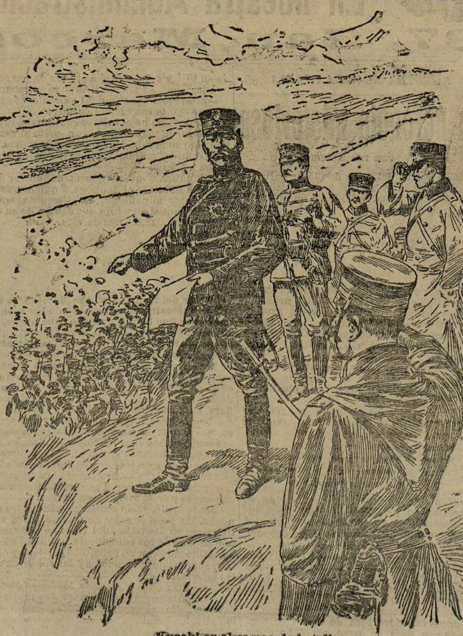
Kuroki en el campo de batalla