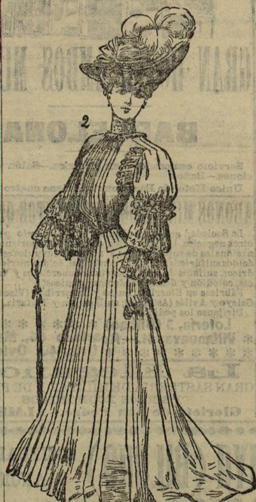
ma completamente lisa. Nuestro modelo núm. 1, es de lanilla azul; la falda forma tres volantes sueltos, bordados por un pespunte y abriéndose en el delantero en forma de abanico. La chaqueta muestra ya la tendencia a hacerse largas y entalladas, tendencia que probablemente seguirán los abrigos este año. El número 2 es un vestido de paje color pastel, adornado en la falda con pliegues y pespunte. La chaqueta lleva incrustaciones de encaje, y

La seda se empleará poco; las gasas, los crepones, los velos y las muselinas se continuarán llevando. Sobre todo los encajes alternarán con las pieles, dando una nota alegre y graciosa al conjunto. Hasta en los trajes de mañana se evita la for-