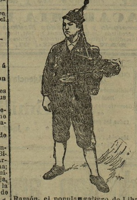
Ramón, el popular gaitero de Libardón.