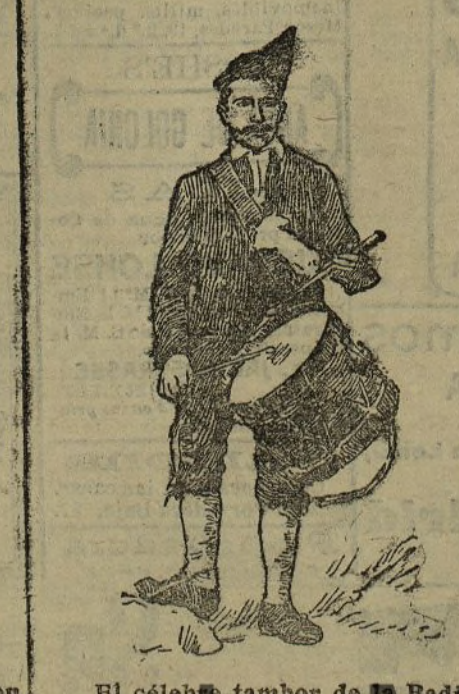
El celebre tambor de la Badía.

Aragón y Salamanca, que vienen á medir con Asturias la belleza de sus cantares y la gallardía de sus bailes. El pueblo invade estas días la plaza de toros, juzga y sentenciada y, en verdad, ningún espectáculo puede ofrecerle lo que mejor le eduque ni más intensamente le emocione.