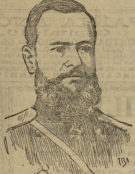
El general Orloff

— Londres 20. Un telegrama de San Petersburgo se hace eco del rumor de que el general Orloff, que en la batalla de Liao-Yang mandaba la división que constituía la extre-