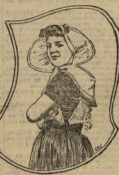
Holandesa de diez y ocho años