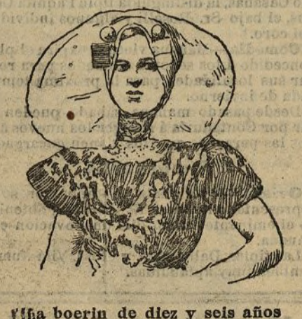
Una boerin de diez y seis años