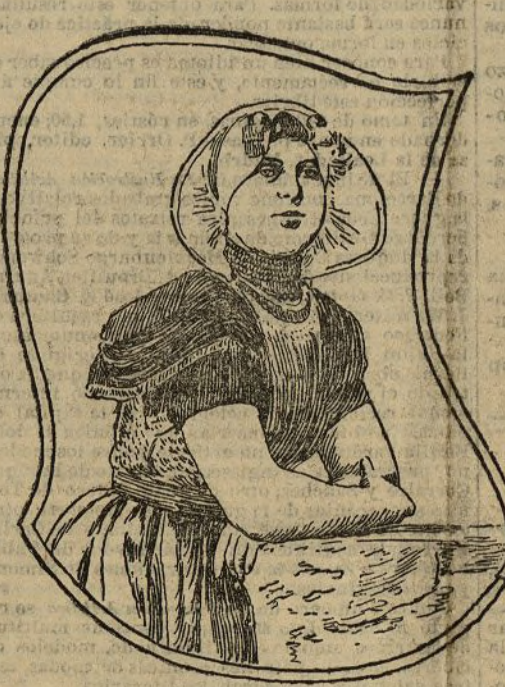
El traje del país de Goe