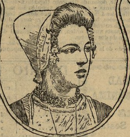
La perla de Walcheren

El que después de un accidentado viaje de recreo, saboreando las delicias que tanto París como Berlín, Viena y Londres ofrecen a sus visitantes, quiera devolver a sus nervios la tensión perdida y grabar en su espíritu una impresión de calma, que sustituya a las que como imágenes cinematográficas pasan por él en el desenfrenado desfile, no regrese a su país sin visitar Holanda.