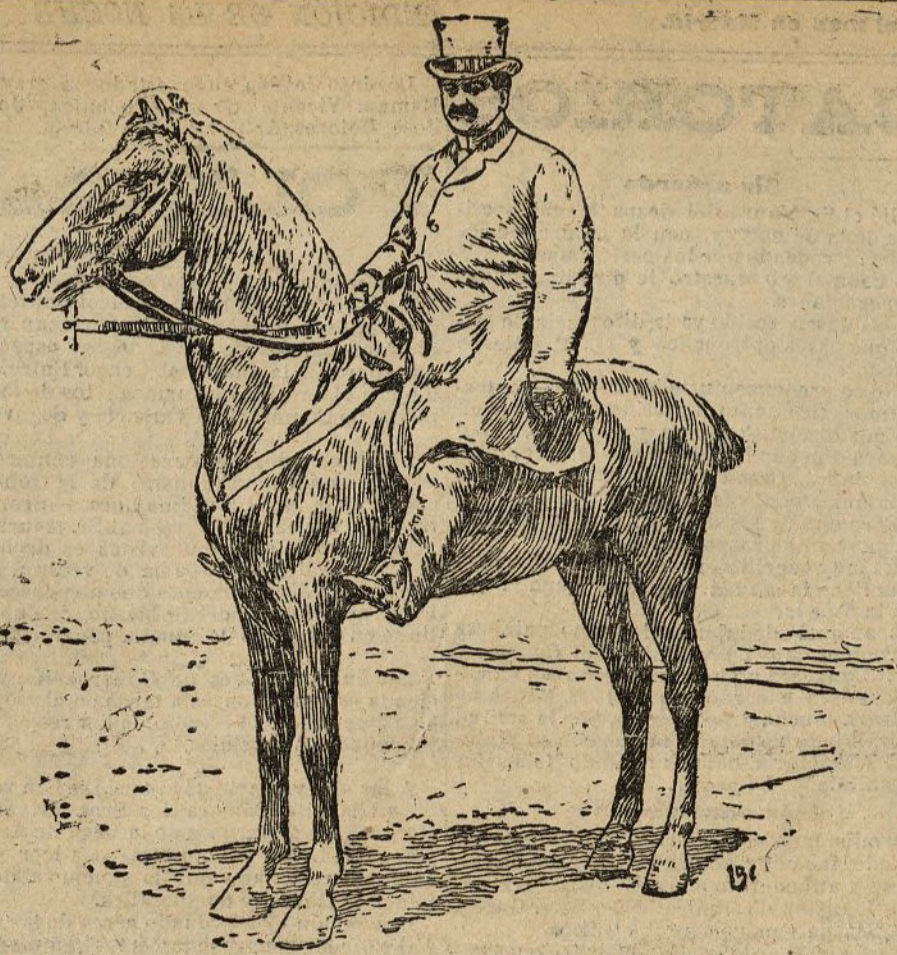
El marqués de Pickman

Incidente, lamentando las causas origen, ante las cuales y caballeramente no han podido proceder de otra manera los que en él tomaron parte.