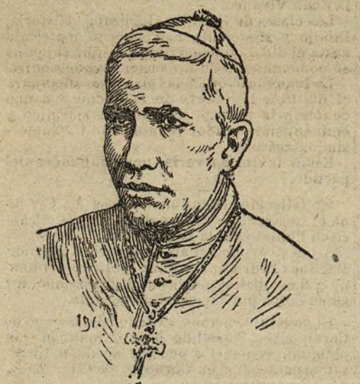
D. Marcello Spínola y Maestre arobispo de Sevilla

El Sr. Azorárraga vuelve á insistir en sus manifestaciones, y dice: «En cuanto nos apremien de trabas y procedimientos de paralización saliendo de esta Cámara, todos estamos