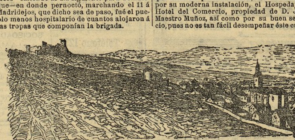
Almonacid de Toledo.—Fin de la primera etapa

La brigada San Martín llegó el 9 a Dos Barrios—salido el día siguiente para Tormele—en donde pernoctó, marchando el 11 a Madrid, que dio de paso, fué el pueblo menos hospitalario de cuantos alojaron a las tropas que componían la brigada.