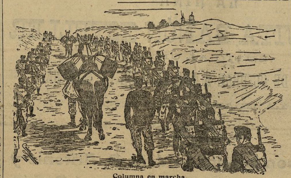
Columna en marcha