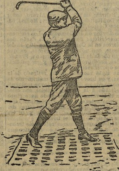
El presidente Roosevelt jugando al "cricket".

tan ruidosos triunfos ha conquistado en las pistas de Buffalo y en el Parque de los Principes, y americano es el bare-bell , extendido