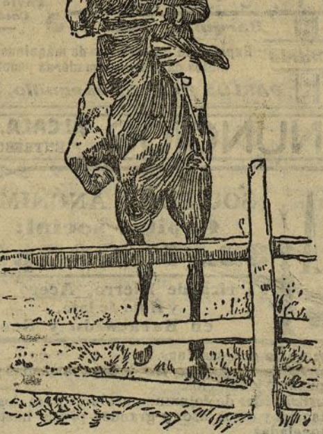
El presidente Roosevelt en su caballo favorito, saltando un obstáculo.

ROOSEVELT, "SPORTMAN" En los Estados Unidos tienen los sports un desarrollo tan grande, que sólo Francia supera a la poderosa nación americana en importancia sportiva . En América, como es sabido, nacieron las más grandes pruebas del automovilismo con la fundación de las Copas fundadas por Gordon-Bennet, el opulento