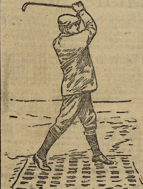
El presidente Roosevelt jugando al "cricket."

tan ruidosos triunfos ha conquistado en las pistas de Buffalo y el Parque de los Principes, y americano es el bar-ball , extendido