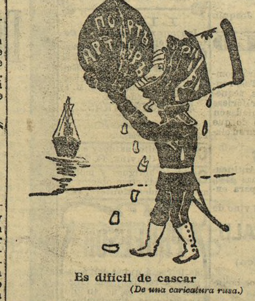
Es difícil de cascar (De una caricatura rusa.)