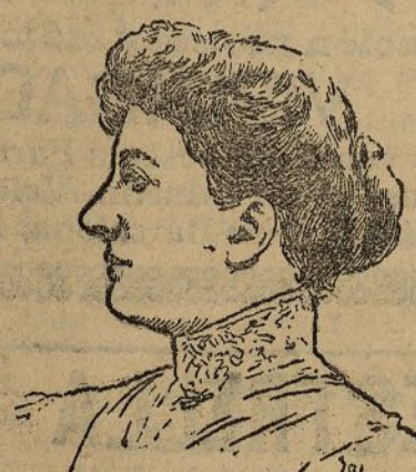
Duquesa de Brissac

De una índole especial, que hace recomendar sólo su lectura a las señoras casadas, es la carti-