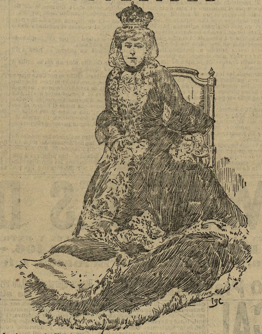
La duquesa de Villahermosa, insignie dama española que acaba de regalar a su país un cuadro, por el que le pagaban millón y medio de francos

be el reglamento de espectáculos, y sería lamentable que baldaran a Riquelme con una multa.