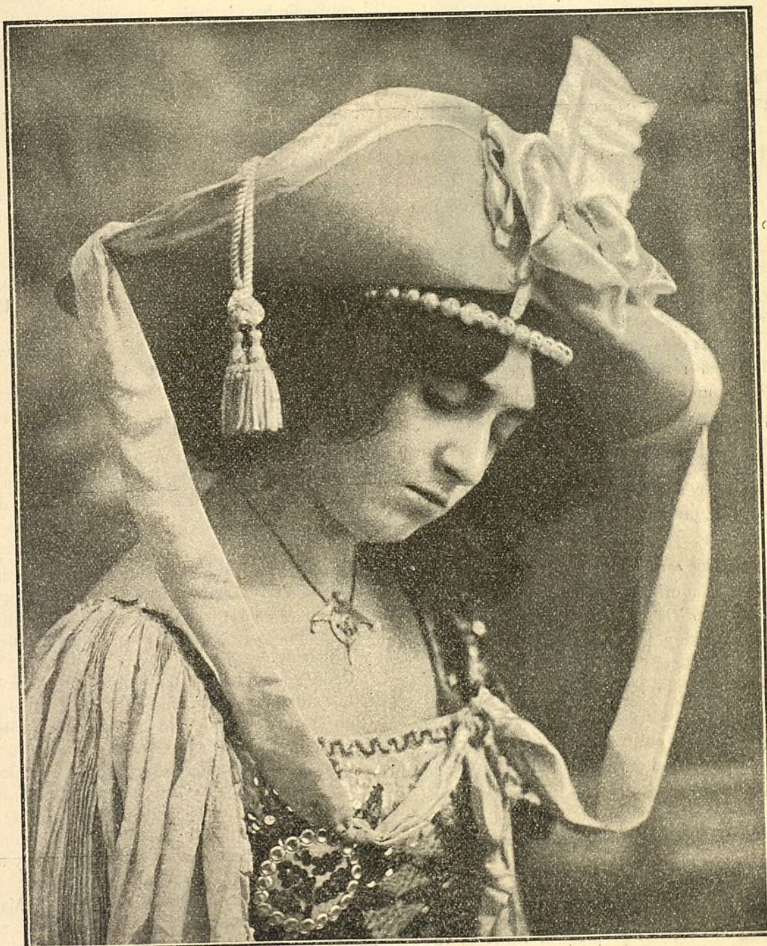
La Bellísima Coupletista BLANCA AZUCENA, del Royal Cine Escudero.