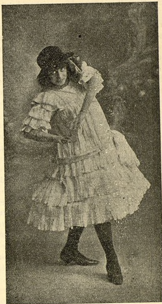
La aplaudida coupletista Blanca Azucena