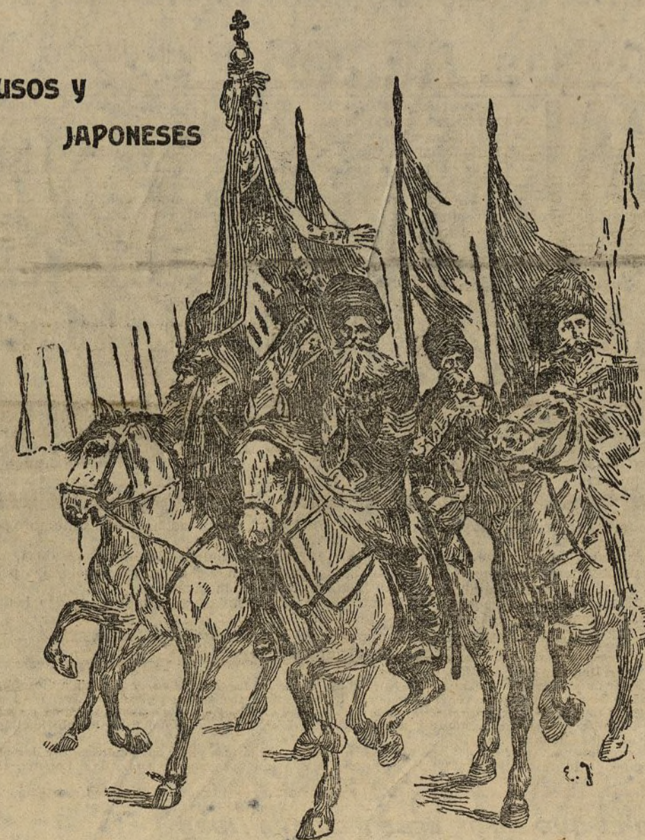
El estandarte de los cosacos siberianos que operan en la Manchuria

prepara su elegante servicio, y ella misma lo sirve a los convidados. Es la hora de descanso en medio de nuestra vida febril; es la hora más higiénicamente galante de la tarde.