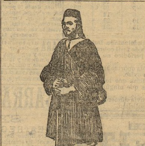
Soldado rifleño al servicio de España

Una de estas dos cosas, cuando menos, reabrirá el marqués del Vadillo de ese alcalde. Si no reabrese, cuando menos, una de estas dos cosas, creeríamos que Maura sigue disfrutando el Poder, que Vadillo es una prolongación de Sánchez Guerra y que los escándalos de Valladolid pueden ahogar á los de Carcabuey sobre el mismo altar de vergonzosa oligarquía.