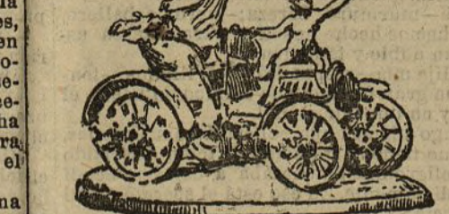
La copa que constituye el premio de la carrera Gordon-Bennett

Los franceses han vuelto a recobrar la Copa. En la carrera eliminatoria, después de