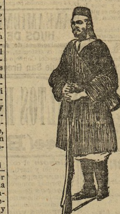
Soldado rifeno al servicio de España

Una de estas dos cosas, cuando menos, recabará el marqués del Vado de ese alcalde. Si no recae, cuando menos, una de estas dos cosas, creeríamos que Maura sigue disfrutando el Poder, que Valladolid es una prolongación de Sánchez Guerra y que los escándalos de Valladolid pueden ahogar a los de Carcabuey sobre el mismo altar de vergonzosa oligarquía.