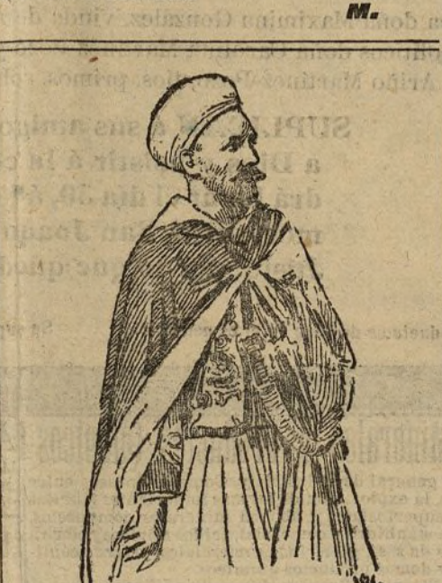
El capitán Larras encargado de la instrucción de las tropas del sultán de Marruecos

De todos modos, es posible que se repitan muchas veces los Hugonotes . Valentina y Raúl bien valen una misa.