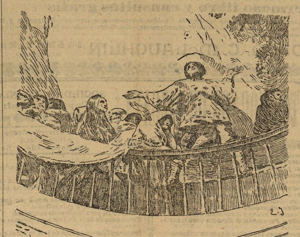
Fragmento (San Isidro) de la cúpula de San Antonio de la Florida, por Goya

La noticia del decreto declarando la iglesia de San Antonio de la Florida monumento nacional, ha producido grato efecto en el público, un tanto alarmado por insistentes rumores de estos días sobre la venta de los frescos de Goya que enriquecen ese oratorio.