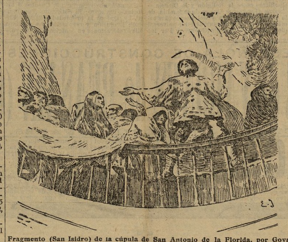
Fragmento (San Isidro) de la cúpula de San Antonio de la Florida, por Goya

La noticia del decreto declarando la iglesia de San Antonio de la Florida monumento nacional, ha producido grato efecto en el público, un tanto alarmado por insistentes rumores de estos días sobre la venta de los frescos de Goya que enriquecen ese oratorio.