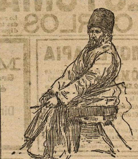
"Izvochtchik" en traje de invierno

—¿Por dónde, pues, me entraba frío? Y, sin embargo, lo sentía; y sin embargo de