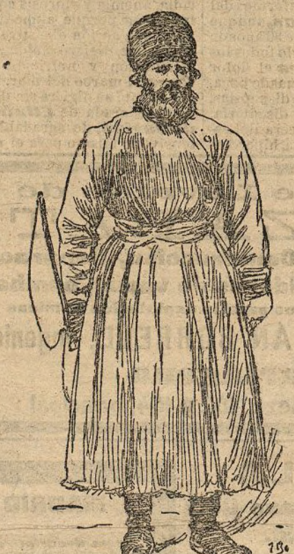
Un "Izvochtchik" particular

Atravesamos largas salas de espera, en cuyas frías soledades reinaba un San Andrés entre dos cirios, y en los mismos dinteles de la estación, unos veinte pos-