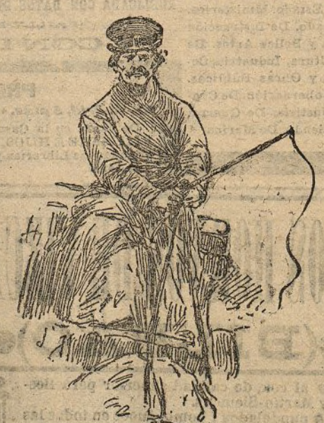
"Izvochtchik" en traje de verano

Esto de la contratación es muy curioso. Los izvochtchiks son tunos; pero el públi-