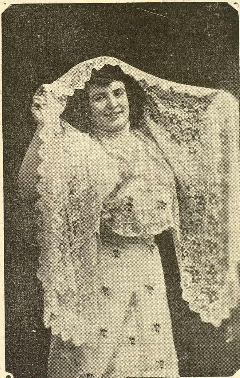
La aplaudidísima tiple cómica VICTORIA ARGOTA