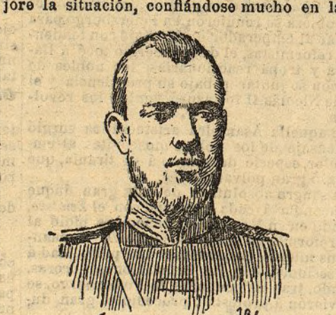
El gran duque Sergio

París 17. Las noticias que se reciben de Tomsk son graves. La huelga es general y la escasez de tropa ha permitido a los estudiantes y a los obreros dominar la ciudad. Las tropas sólo tratan de guardar la estación para impedir que ataquen la línea principal del transiberiano y destruyan los importantes almacenes. De San Petersburgo siguen recibiendo malas noticias respecto a la agitación de los aldeanos.