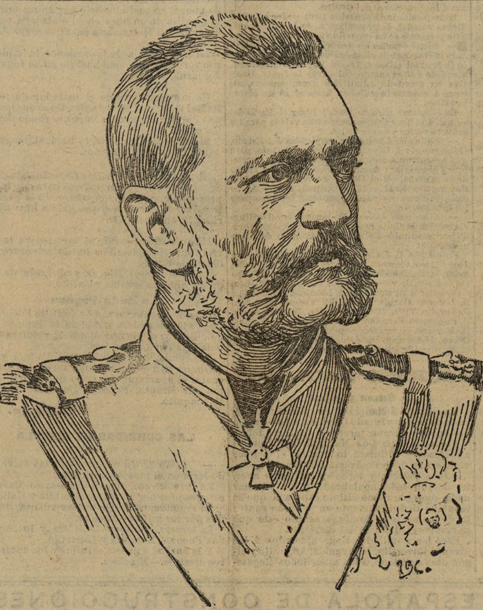
EL GRAN DUQUE WLADIMIRO

Los tipos y las escenas de La vara de alcaide están copiados del natural con raro acierto, y eso da a la obra un singular mérito, el de semejarse más a la vida que al tipo convencional de una acción cómica que sirve de fondo a la acción principal dramática, sobriamente desarrollada. En ese fondo es precisamente donde el Sr. Melantuche ha demostrado más su talento de pintor de género, y con él habiéndose bastado a muchos auto-