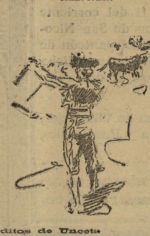
Apuntes inéditos de Unceta