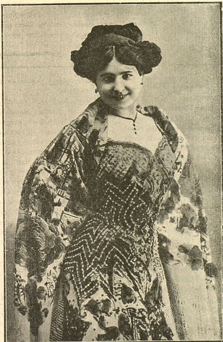
La bellísima coupletista Adela Lulú