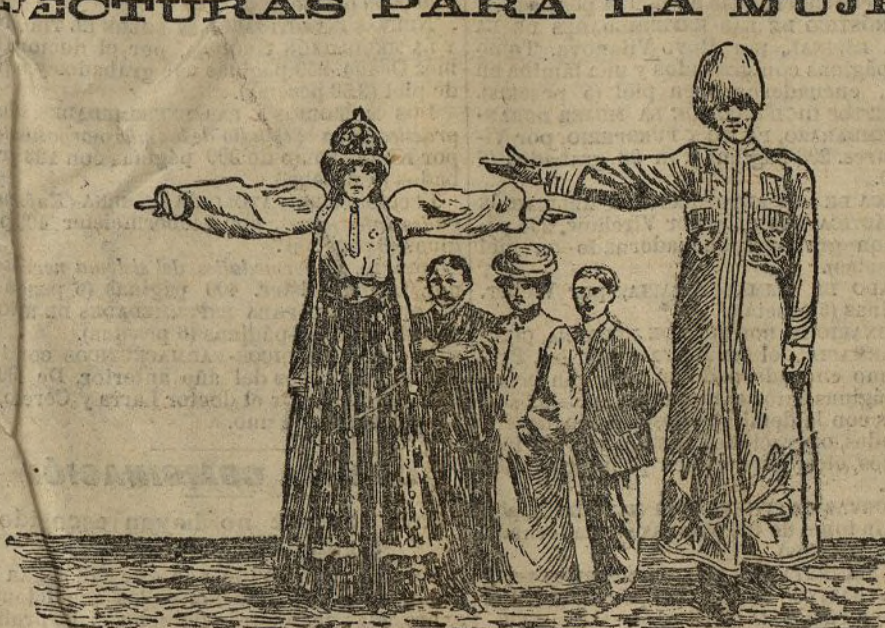
La pareja más alta del mundo

Con frecuencia hemos dado noticias de mujeres exploradoras, y hoy tenemos que añadir el nombre de Lady Delamere, que es a la vez gran dama, exploradora y cazadora.