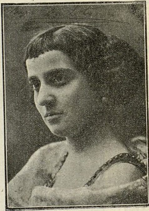
La aplaudida primera tiple cómica CARLOTA PAISANO.