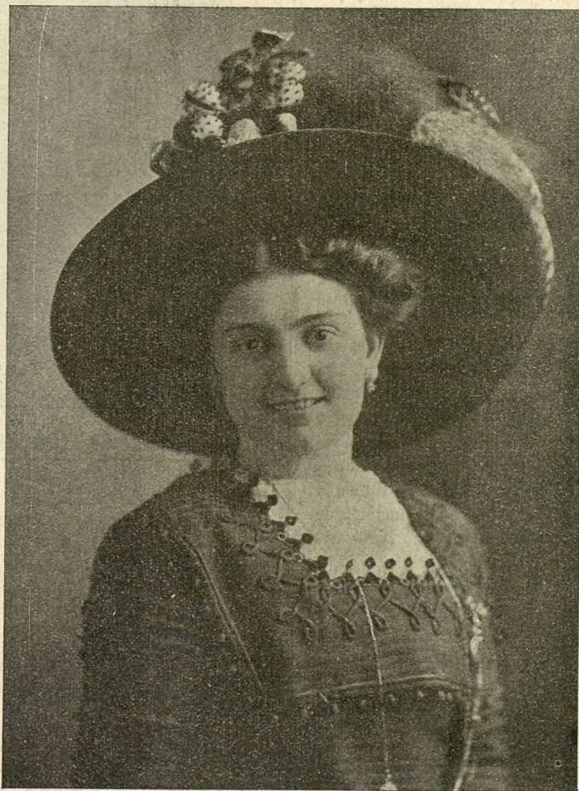
LA BELLA Y APLAUDIDA PRIMERA TIPLE CONCHITA GIL