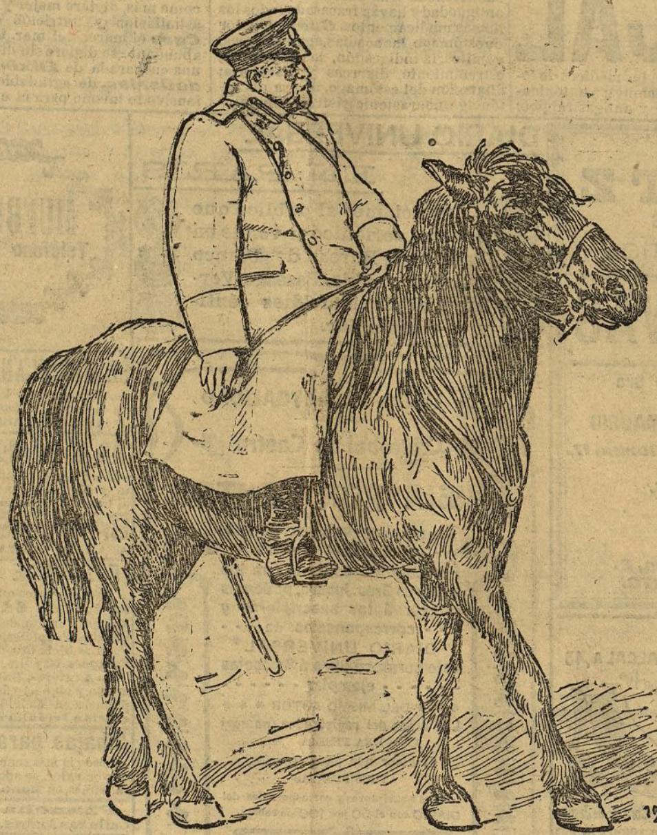
El nuevo generalísimo de las fuerzas rusas en la Manchuria, general Linievich

Iglesias nos muestra, perfectamente reproducido, un trozo de vida del que podríamos sacar provechosa lección si fuésemos capaces de aprender algo de la vida misma en lugar de aprenderlo todo en libros gordos sin pizca de jugo, casi siempre, y Borrás reproduce con perfecta verdad, salvo algunos detalles como el de las manos, demasiado pulidas, que anoche lució, el tipo obrero anciano y sin pan visto por Iglesias. Sin la trágica escena de la muerte, en la que Borrás toca en lo sublime, sería ya la interpretación digna de los mayores elogios, y no hay que decir que con ella es de las que merecen ser señaladas con piedra blanca.