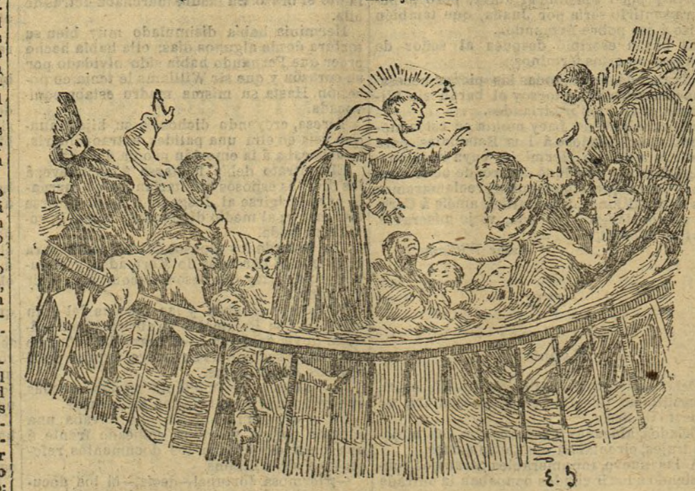
Fragmento de la cúpula de San Antonio de la Florida

Total general: 63 buques de combate, con 217.529 toneladas.