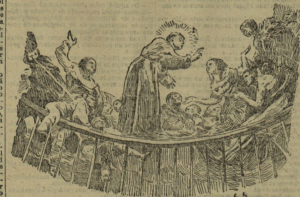
Fragmento de la cúpula de San Antonio de la Florida

Muchos consideran los frescos de San Antonio de la Florida—esa tacita de plata—como la obra suprema del maestro; lo será o no; pero lo cierto es que tenerla abandonada, a merced de la rapia de chararileros y extranjeros y a la lima roedora de los años, era pecado de lesa arte, explicable sólo por la indiferencia nacional, duena y señora de chicos y grandes, del público, de los académicos y de los ministros. Fue necesario dar el grito de alarma para que se haya caído en la cuenta de hacer lo que hace mucho tiempo debía estar hecho; pero nunca es tarde si la dicha es buena. Regocijémonos, en fin; la popular ermita madrileña, la de las verbenas castizas y alegres, ha sido declarada monumento nacional; nada semejante se habrá hecho con más justicia.