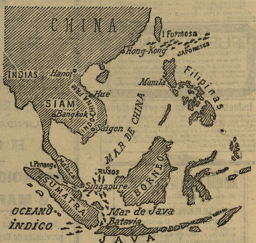
Mapa de los lugares en que probablemente se desarrollarán las operaciones navales de las escuadras rusa y japonesa

En estos días la atención del mundo está pendiente de los resultados del grandioso combate que va a realizarse en los mares de China entre las poderosas escuadras rusas y japonesas mandadas por los almirantes Rodjestvensky y Togo.