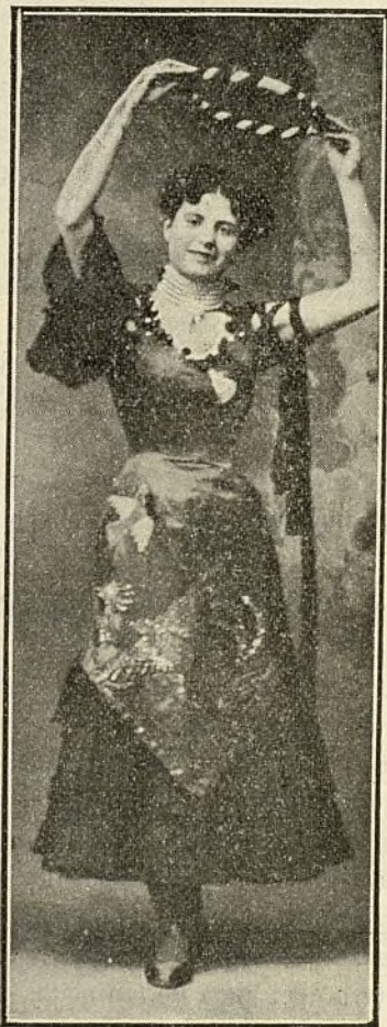
La bellísima y escultural equilibrista en el trapecio Clarita Diaz