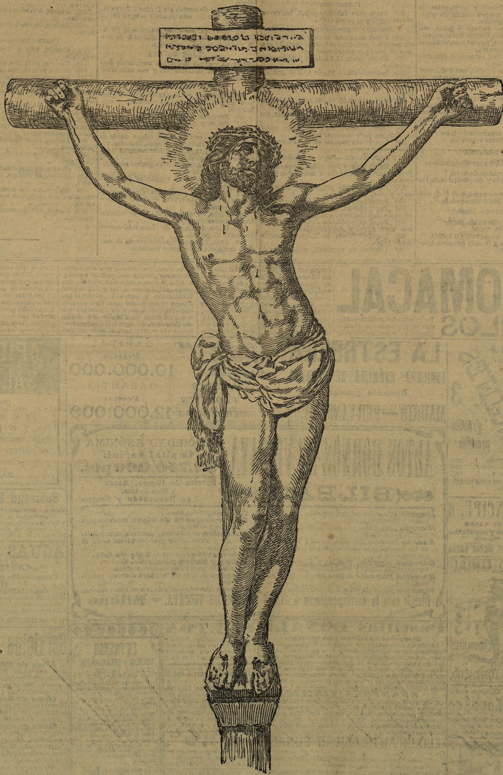
EL CRISTO DE SAN GINÉS

Toda esta gente se pone en extraordi-nario movimiento y actividad, ligada la