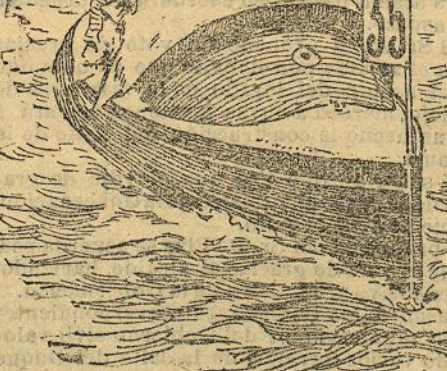
«Jollette III», «Cruisers» de 6,50 m., vencedora en la carrera de la primera serie de esta categoría

Cuatro de estas caños salen a luchar. El