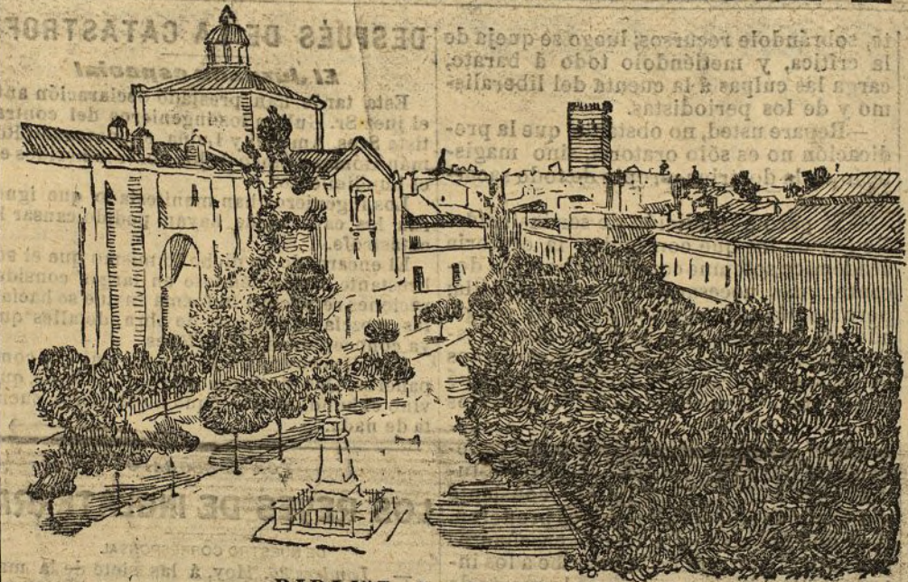
BADAJÓZ.—La plaza de Minayo