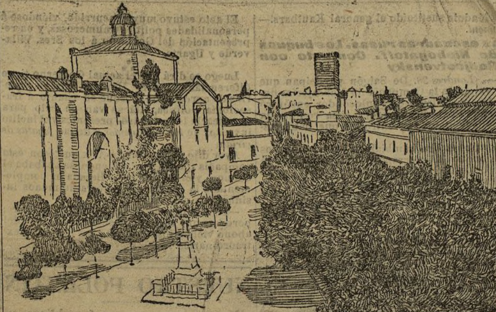
BADAJOS.—La plaza de Minayo

La llegada. — Caceres 25. El día se presenta muy espléndido animando el hermoso espectáculo que ofrece la ciudad, toda adornada, esperando la llegada del rey. En este momento las Comisiones dirigidas a la estación ocupando más de 30 carruajes. La animación es extraordinaria. Todos los balcones lucen vistosas colgaduras.