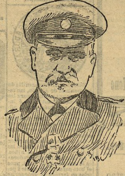
El contraalmirante Niebogoroff comandante de la segunda escuadra rusa del Pacifico