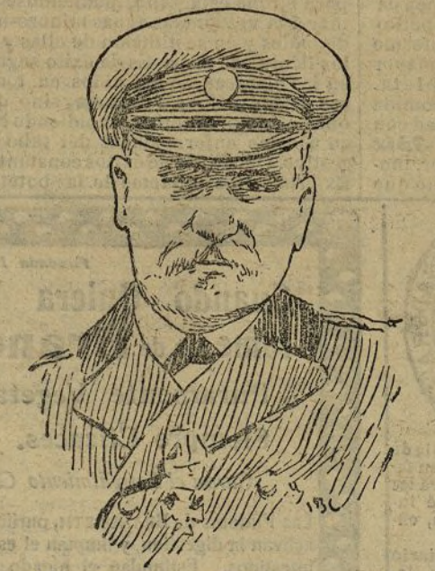
El contraalmirante Niebogotoff, comandante de la segunda escuadra rusa del Pacífico

En muchas casetas se bailaron las clásicas sevillanas. El tiempo desapacible.—Reyes.