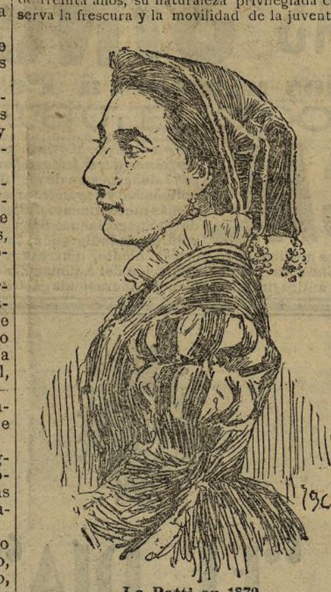
La Patti en 1872

Adelina es de regular estatura, de ojos negros y gran fuerza física; inteligente y animada, que seduce más por la gracia que por la belleza. A pesar de su edad, la Patti no representa más de treinta años; su naturaleza privilegiada conserva la frescura y la movilidad de la juventud.