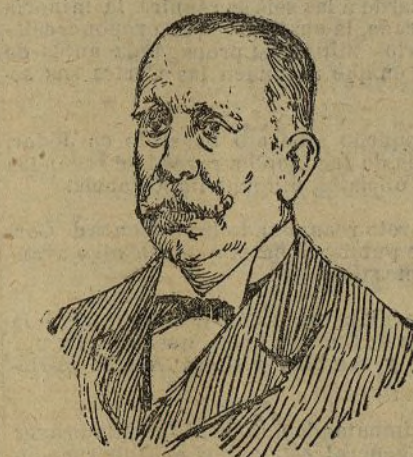
D. Evaristo Martín Núñez alcalde de Ciudad Real

Después de haberse dirigido al Ayuntamiento, el rey se dirigió al cuartel del Campo de San Roque, donde se le esperaba.