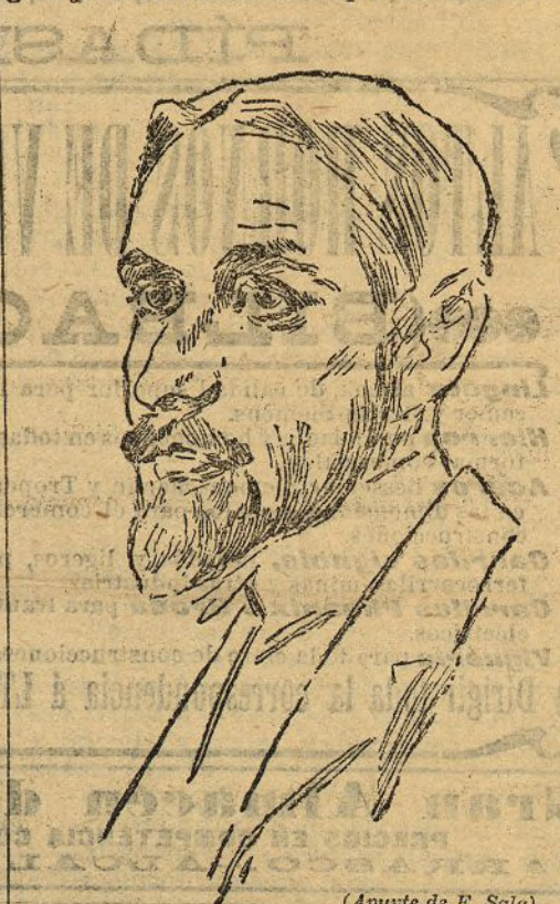
(Apunte de E. Sala)

Concélese que pueda venir al mundo un ser extraño, excepcional, ajeno á nuestra común naturaleza y á nuestro peculiar carácter, genial, desequilibrado ó superhombre , si quisiéramos, y que ese ser extraordinario pueda tener media docena de admiradores que con afán quadrumano lo copien los detalles extremos de su vestir, imiten sus gestos y modales y con asombro de papáes lo contemplen y lo escuchan; aun llegado este caso, la perturbación no sería grande, y limitándose los efectos á un cortísimo número de personas, la humanidad permanecería impasible. Lo único invariable en el tiempo y en el espacio, lo universal, lo que á todos llega y todos comprenden, es la natural expansión de la vida con sus anhelos y pasiones, sus vacilaciones y dudas, sus alegrías y tristezas, sus amores, sus odios, sus ideales, sus nostalgias y melancolías. Esto que cada cual le