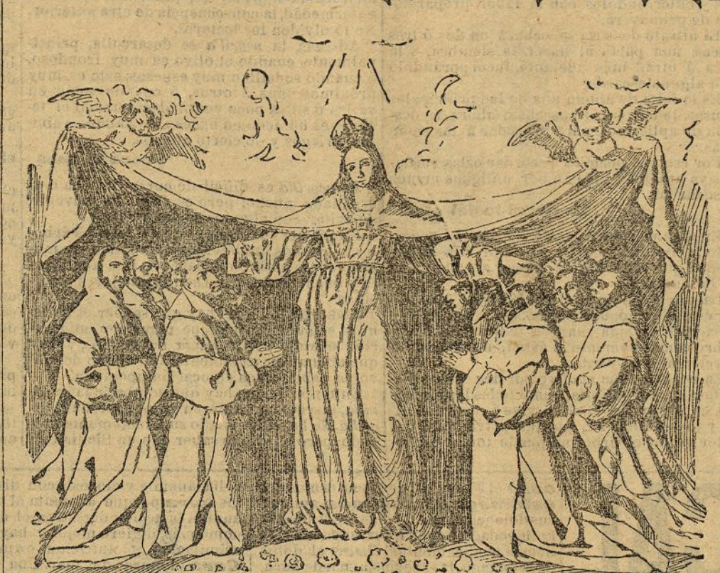
La Virgen de la Cueva

La fecha de apertura al público de la nueva sala del Museo Nacional destinada á la exhibición de obras del maestro español contemporáneo de Velázquez, depende de la llegada de los cuadros procedentes de Castellón y Cádiz, cuyo envío está anunciado hace días.