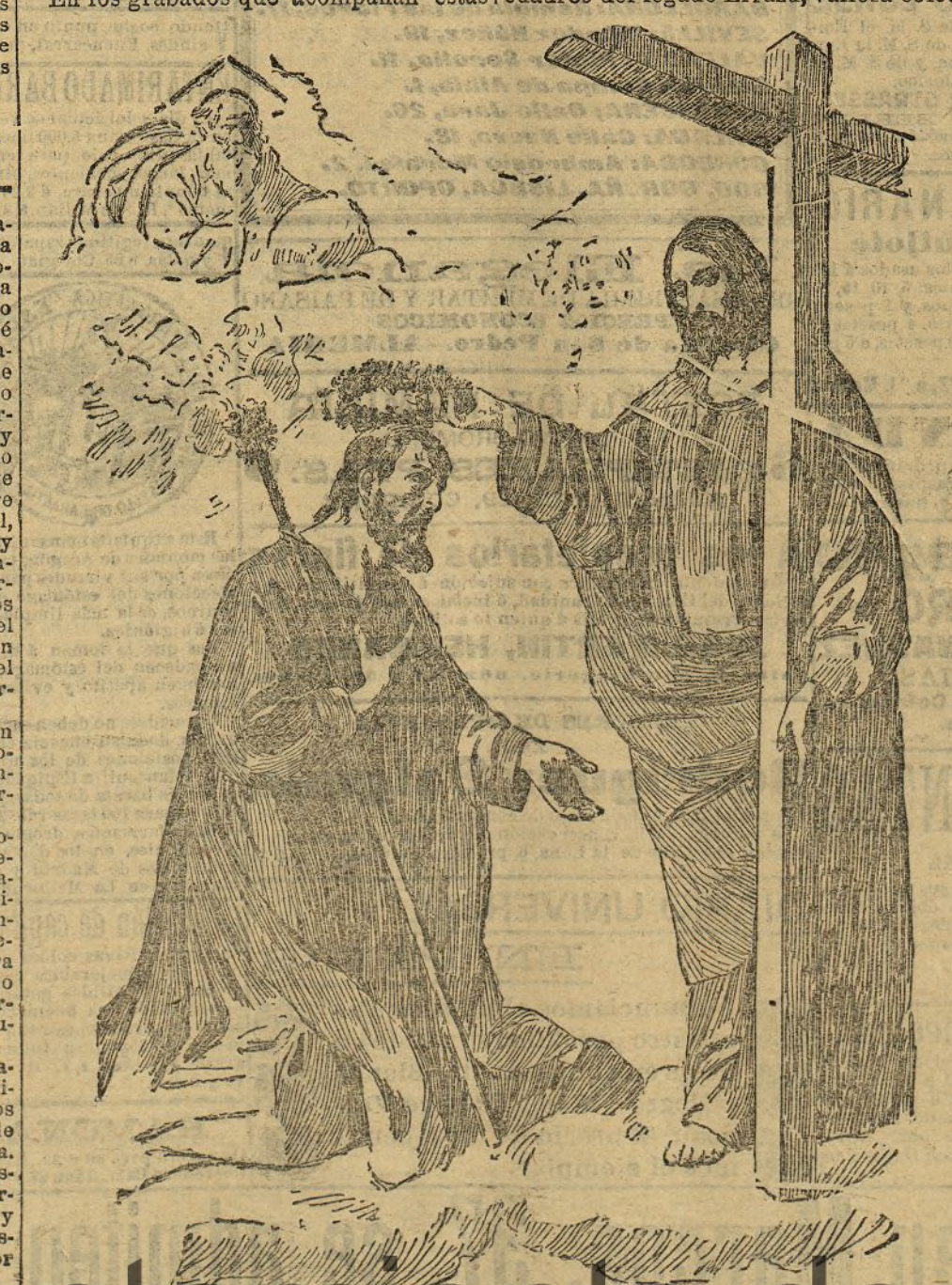
La coronación de San José

Es una verdadera pena que esta infundada resistencia prive al público de conocer aquellas notables y quizás las mejores obras del famoso pintor extremeño. En los grabados que acompañan estas