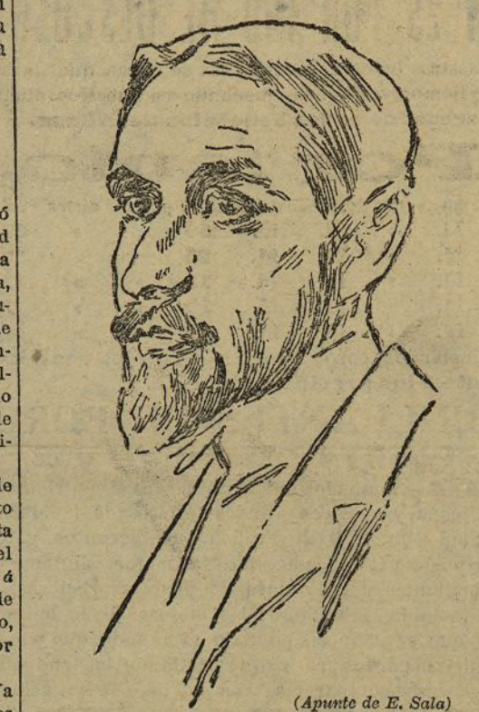
(Apunte de E. Sala)

Lo único invariable en el tiempo y en el espacio, lo universal, lo que á todos llega y todos comprenden, es la natural expansión de la vida con sus anhelos y pasiones, sus vacilaciones y dudas, sus alegrías y tristezas, sus amores, sus odios, sus ideales, sus nostalgias y melancolías. Esto que cada cual le