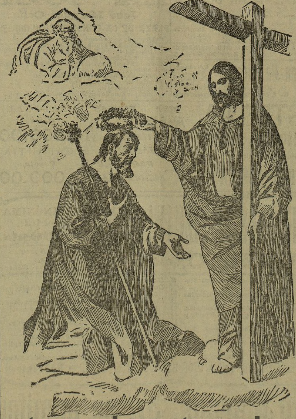
La coronación de San José

Contigua al salón de las obras del pintor extremeño se encuentra una rotunda, más bien un joyel, de cuyos muros, decorados por rico raso gótico, penden los cuadros del legado Errazu, valiosa colección de grabados que acompañan estas