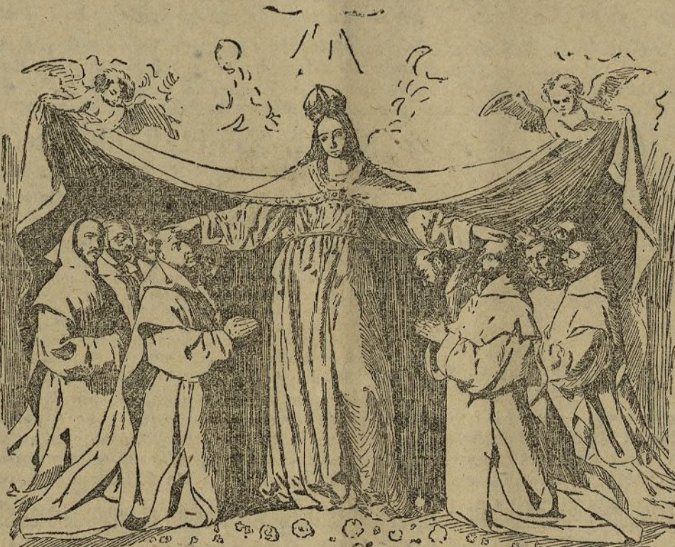
La Virgen de la Cueva

La fecha de apertura al público de la nueva sala del Museo Nacional destinada á la exhibición de obras del maestro español contemporáneo de Velázquez, depende de la llegada de los cuadros procedentes de Castilla y Cádiz, cuyo envío está anunciado hace días.