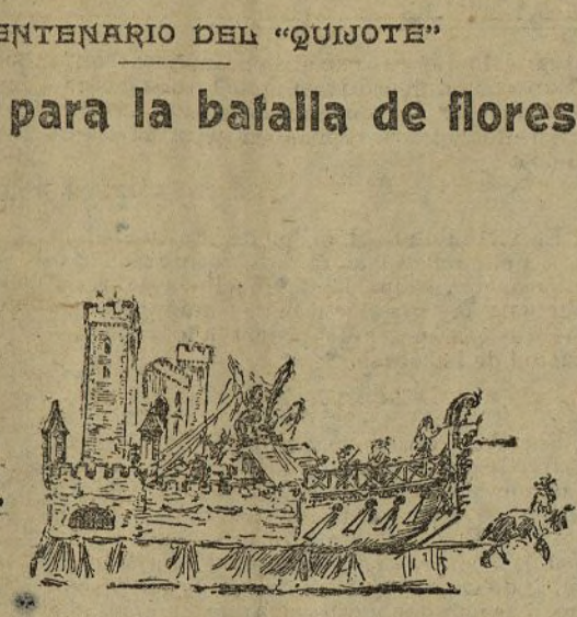
La carroza del Ayuntamiento