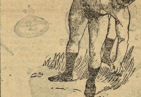
Hackenschmidt entrenándose con uno de sus ayudantes

El ruso manejó a Jenkins más fácilmente que en Londres y no pudo conseguir hacer