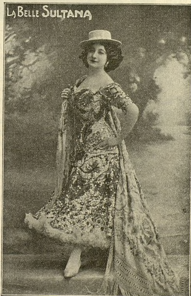
La simpática bailarina y notable canzonetista BELLA SULTANA