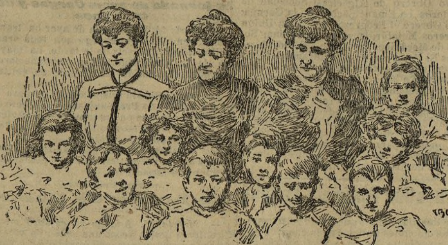
Grupo de profesoras y escolares de la Cantina de la calle de Trafalgar

Hace muchos años, cuando yo no era escritor ni maestro, leía un bello libro pedagógico, en el que encontraba ideas de adelantos y de progresos que aún no se conocían entre nosotros.