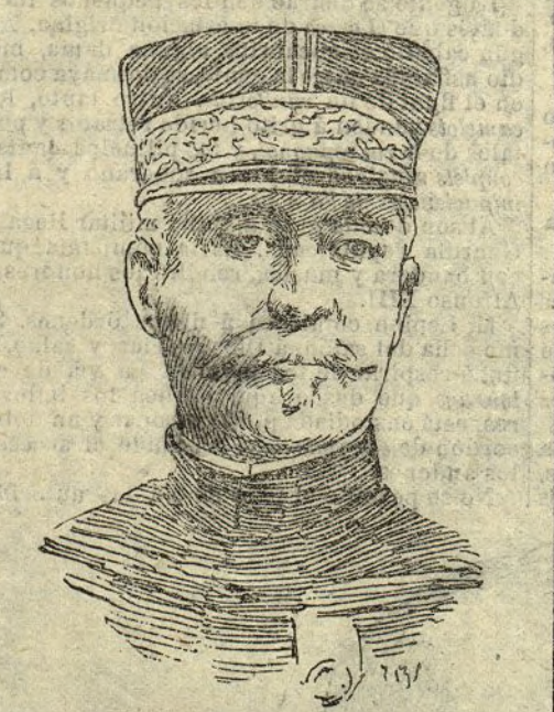
El general Debatisse agregado a la comitiva de Alfonso XIII

de color de mil sombrillas. Los Campos Elíseos son un gran esplendor; hay, a centenares, automóviles de todas las marcas, y