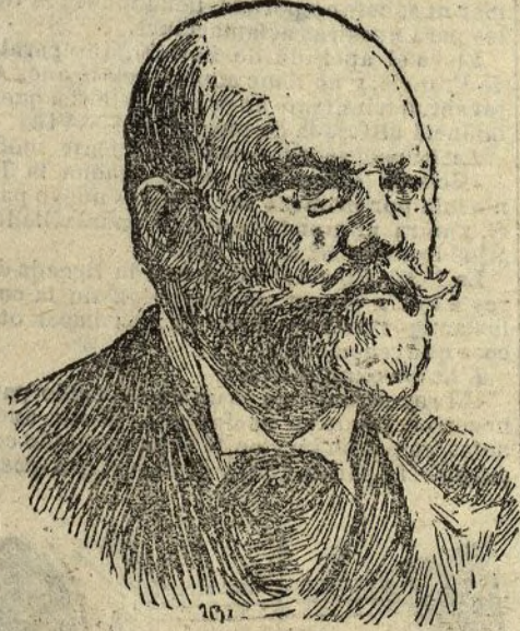
León y Castillo